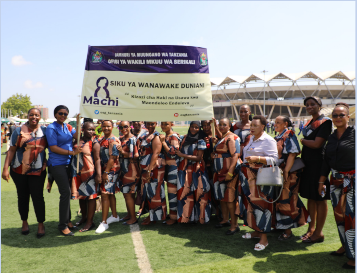
Picha ya pamoja ya baadhi ya Wanawake wa Ofisi ya Wakili Mkuu wa Serikali kwenye maadhimisho ya Siku ya Wanawake Duniani