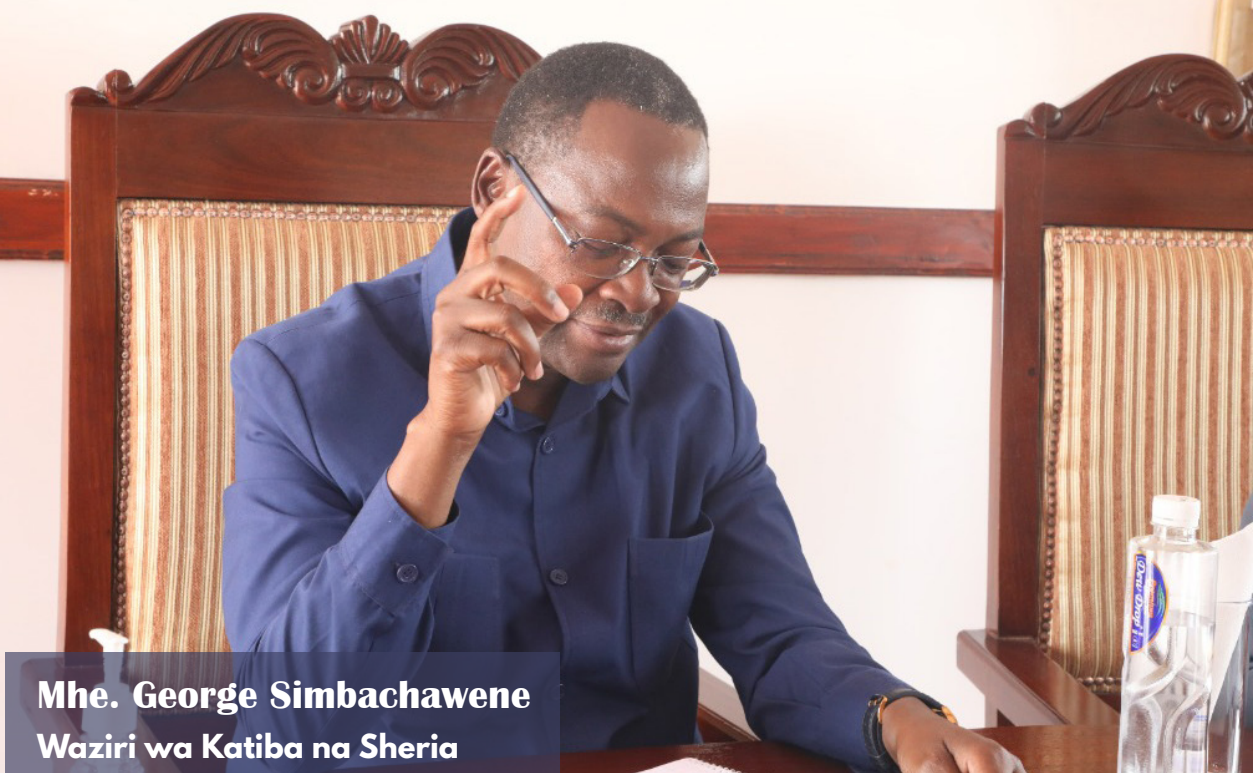
Mhe. George Simbachawene Waziri wa Katiba na Sheria