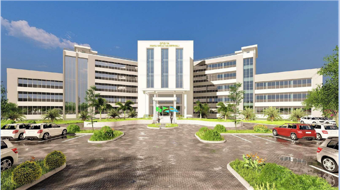
Muonekano wa Mbele (front view) wa Jengo jipya la Ofisi ya Wakili Mkuu wa Serikali linalotarajiwa kujengwa katika Mji wa Serikali Mtumba Jijini Dodoma