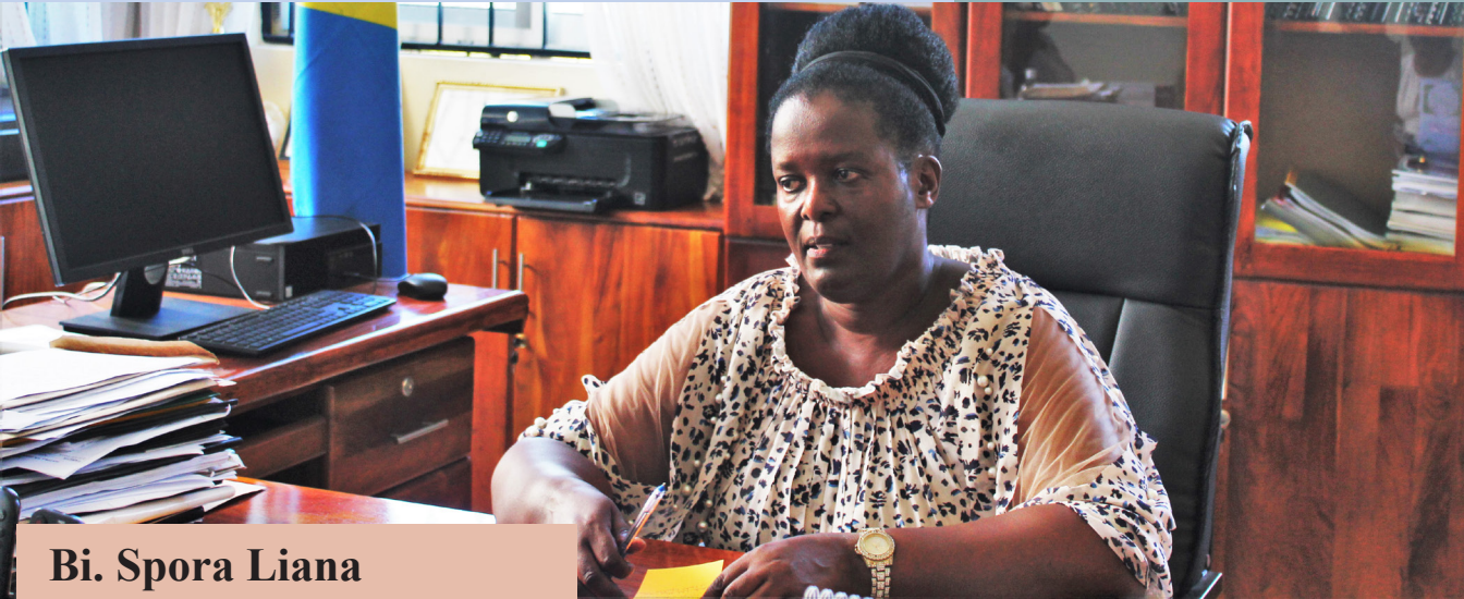
Bi. Spora Liana Mkurugenzi wa Jiji la Tanga

O fisi ya Wakili Mkuu wa Serikali mkoani Tanga imepongezwa kwa usimamizi mzuri wa Mashauri ya Serikali na Taasisi zake kwa kuweza kusaidia kuwajengea uwezo Mwakili wa Taasisi nyingine katika kuandaa na kusimamia Mashauri dhidi ya Taasisi zao.