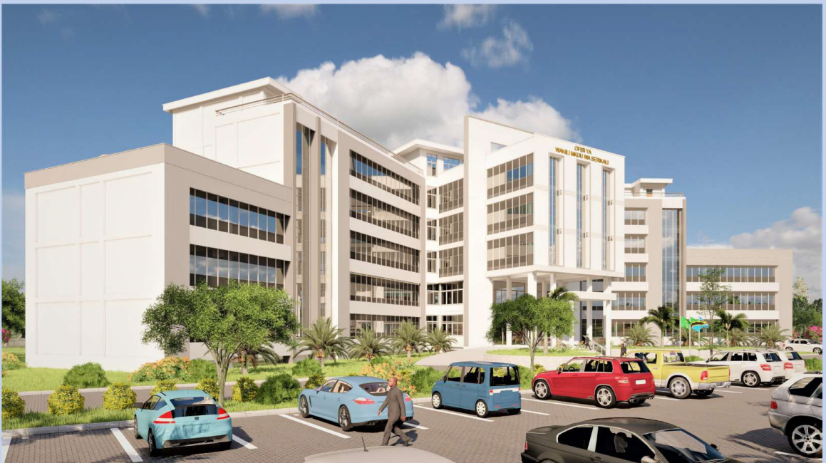
Muonekano kwa upande (side view) wa Jengo jipya la Ofisi ya Wakili Mkuu wa Serikali linalotarajiwa kujengwa katika Mji wa Serikali Mtumba Jijini Dodoma