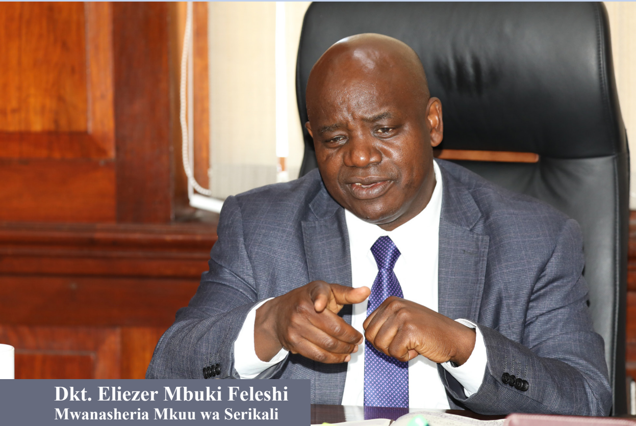
Dkt. Eliezer Mbuki Feleshi Mwanasheria Mkuu wa Serikali