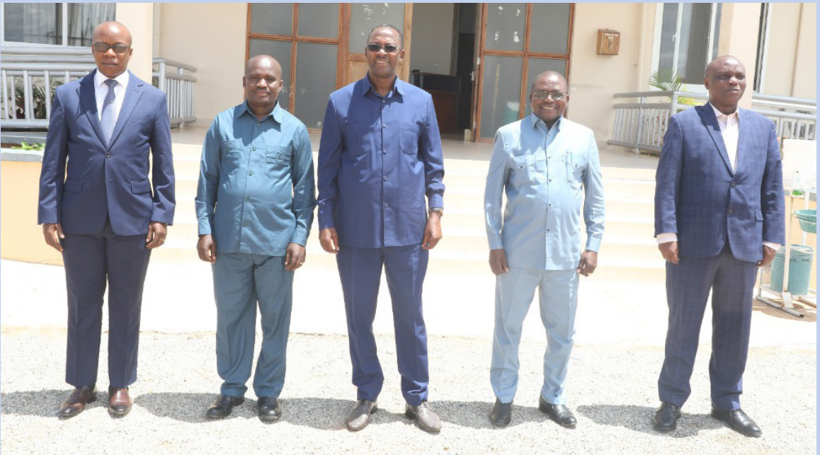
Waziri wa Katiba na Sheria Mhe. George Simbachawene (katikati) akiwa katika picha ya pamoja na Viongozi wa Ofisi ya Wakili Mkuu wa Serikali walipofika kujitambulisha ofisini kwake jijini Dodoma

Kikao hicho kimefanyika katika ukumbi wa mikutano wa Wizara ya Katiba na Sheria uliopo Mtumba Jijini Dodoma, kimewahusisha Viongozi wa Tasisi kutoka Ofisi ya Wakili Mkuu wa Serikali, Ofisi ya Mkurugenzi wa Mashtaka pamoja na Tume ya Haki za Binadamu na Utawala Bora.