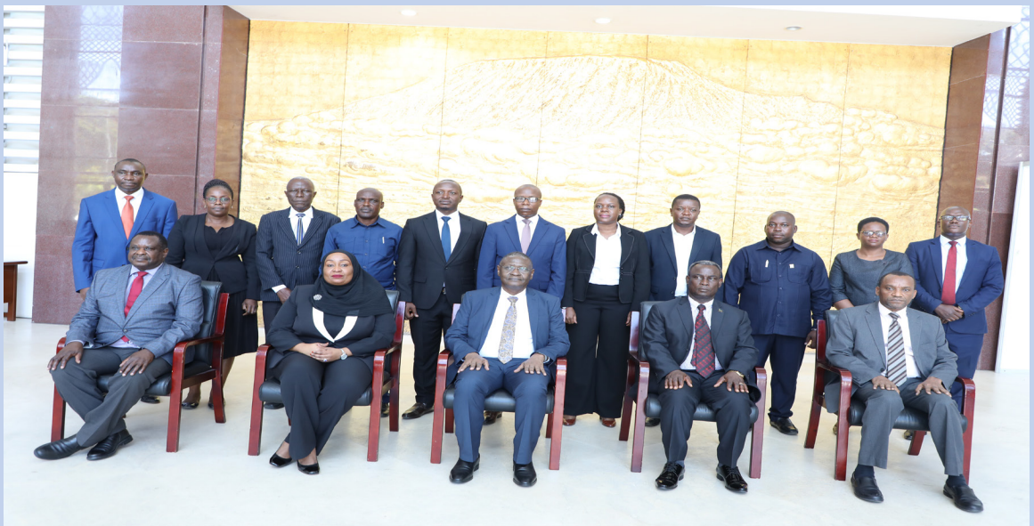
Jaji Mkuu wa Tanzania Mhe. Prof. Ibrahim Hamis Juma (katikati walioketi) akiwa katika picha ya pamoja na Viongozi waliohudhuria hafla ya uzinduzi wa vitabu vya mkusanyiko wa Maamuzi ya Mahakama ya Kazi