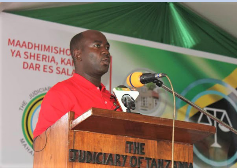
Mhe. Ngwilabuzu Ludigija Mkuu wa Wilaya ya Ilala