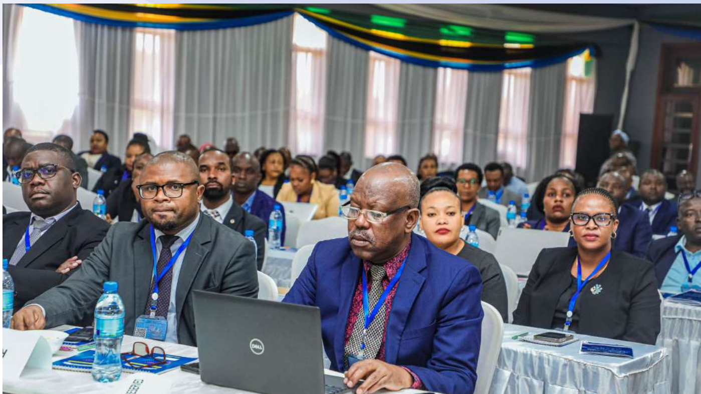
Mawakili wa Serikali walioshiriki Mafunzo wakimsikiliza Naibu Waziri wa Katiba na Sheria, Mhe. Jumanne Sagini (Mb) (hayupo pichani) wakati akifungua mafunzo hayo yaliyofanyika jijini Arusha.