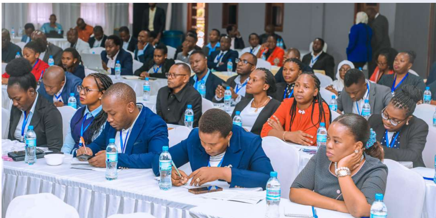
Mawakili wa Serikali wakiwasikiliza wawezeshaji wa mada zilizotolewa wakati wa mafunzo kwa Mawakili hao yaliyofayika Jijini Arusha.

ya kisheria. Pia, kutaweka mazingira rafiki ya uwekezaji nchini kwakuwa migogoro ya uwekezaji inaweza kutatuliwa kwa njia ya maridhiano.