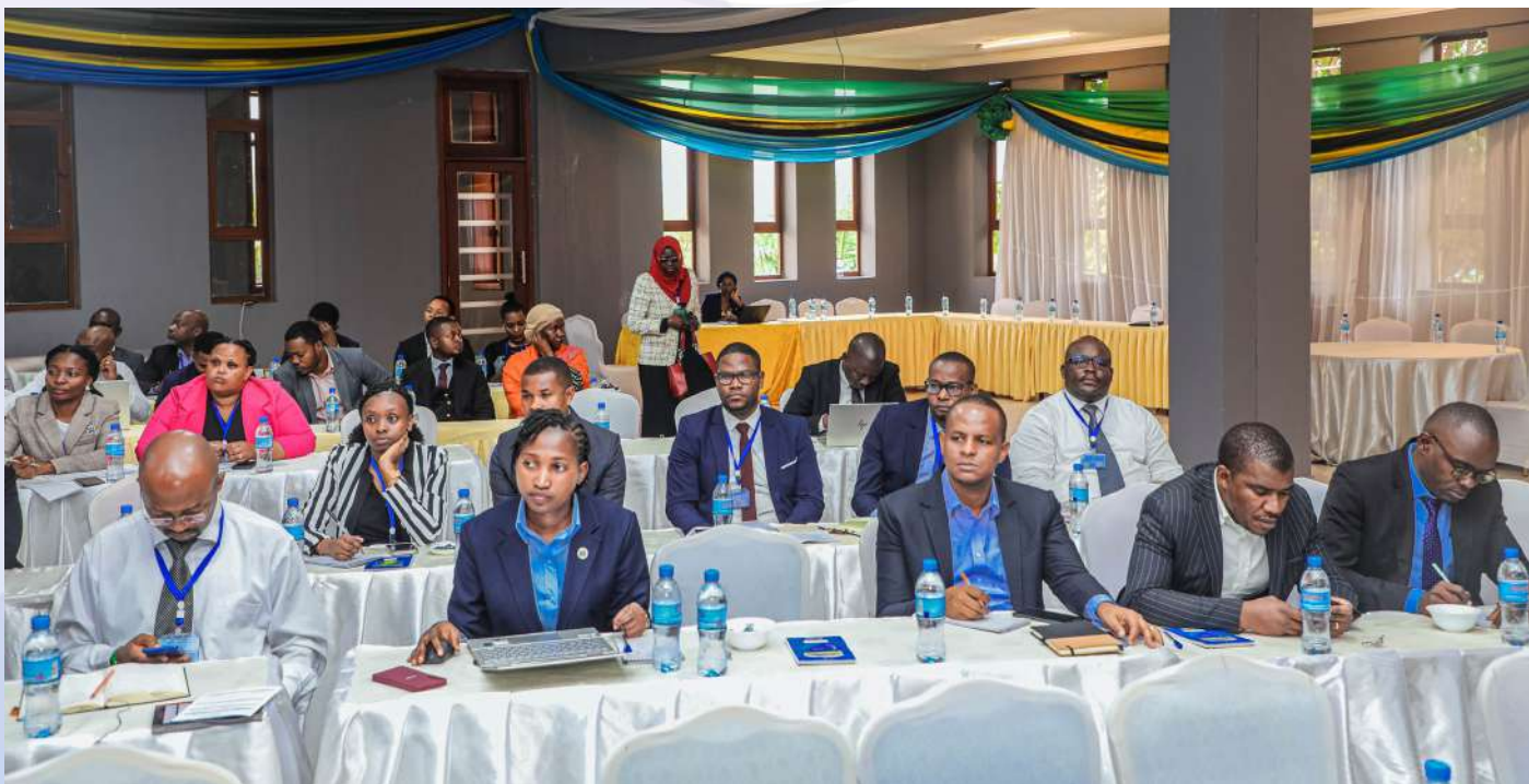
Mawakili wa Serikali wakiwasikiliza wawezeshaji wa mada zilizotolewa wakati wa mafunzo kwa mawakili hao yaliyofayika Jijini Arusha.