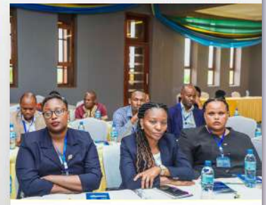
03 April, 2024 MAMASHINDA SHAURI LA USULUHISHI KATIKA...