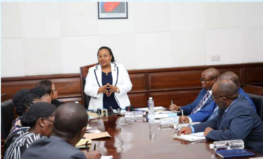
Waziri wa Katiba na Sheria, Mhe. Balozi Dkt. Pindi Chana (Mb) akizungumza na Menejimenti ya Ofisi ya Wakili Mkuu wa Serikali alipotembelea Ofisi hiyo akiwa kwenye ziara yake ya kikazi Jijini Dar es Salaam.