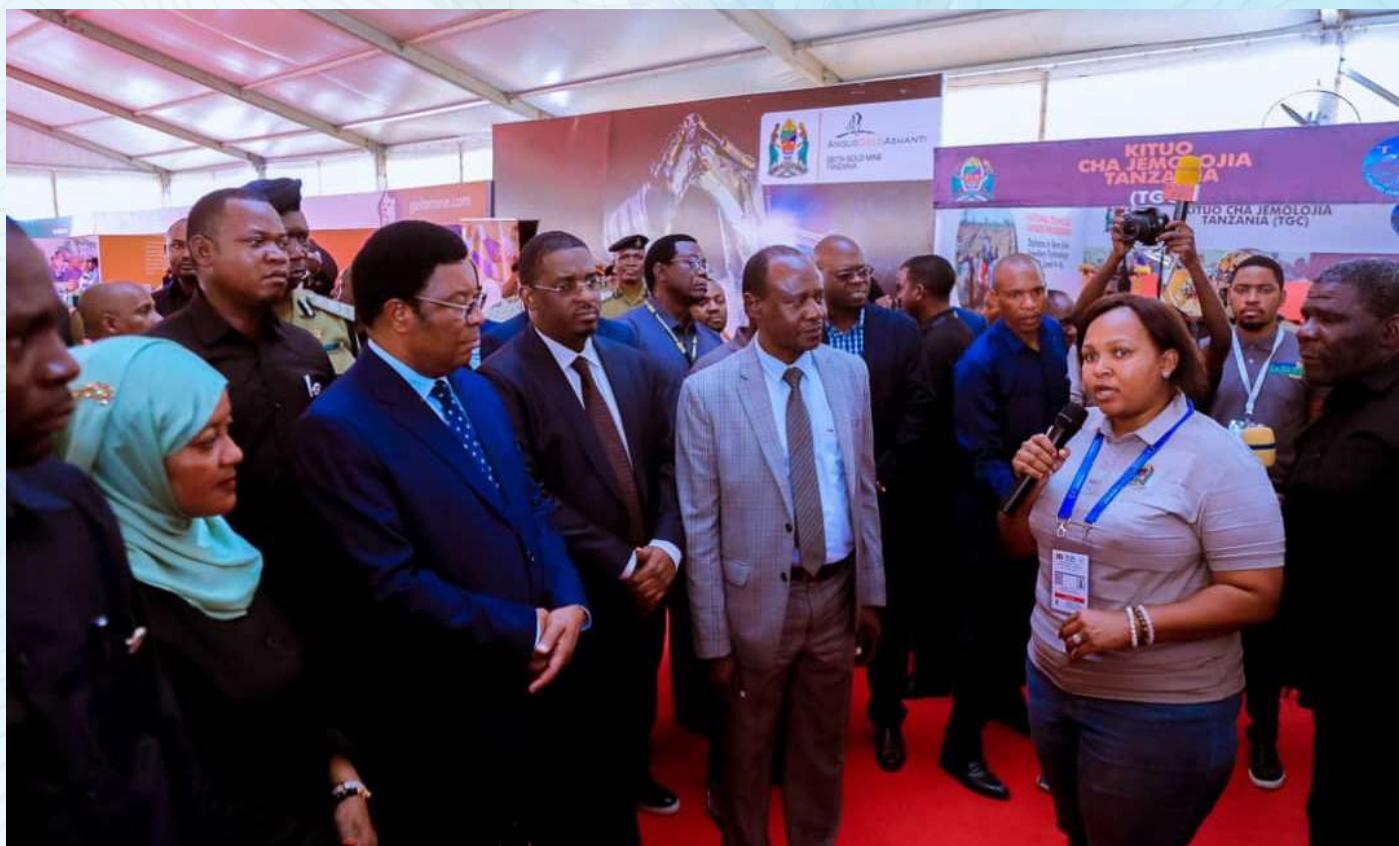
Waziri Mkuu wa Jamhuri ya Muungano wa Tanzania Mhe.Kassim Majaliwa akitembelea mabanda katika Maonesho ya 47 ya Kimataifa ya Biashara, yaliyofanyika kwenye Viwanja vya Manonesho vya Sabasaba, jijini Dar es Salaam.